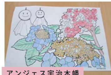
アンジェス宇治木幡