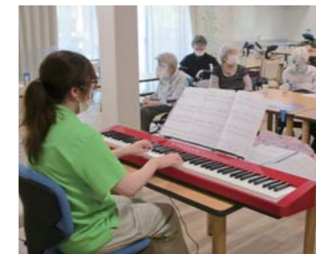
アンジェス嵯峨広沢