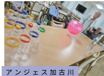
アンジェス加古川