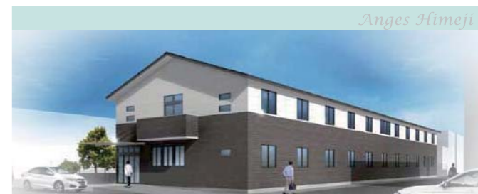
兵庫県姫路市 アンジェス姫路