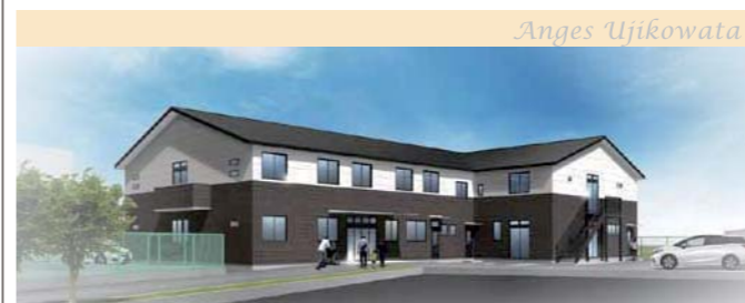
京都府宇治市 アンジェス宇治木幡